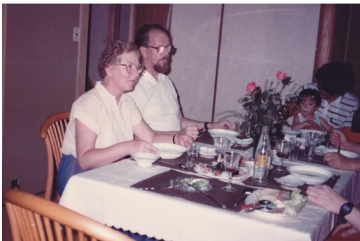
(写真1) 食事中的教授ご夫妻(自宅で)

日本の家に来られるのは初めてのようでした。大変でしたが家の雰囲気を味わっていただけと思いました(写真1)。