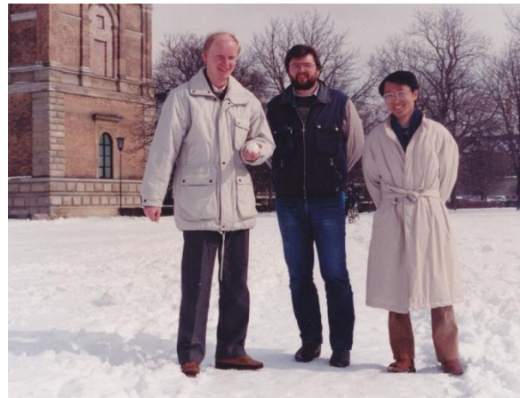
(写真2) メンザからの帰り・ドクトラントの方々と

レーラー教授はサイバネティックスが専門で、さらに新しい光学的測定法の開発及びこれを利用した生体硬組織の力学的特性や自動車の運転中等の視覚系の認識に関する研究を行っておられました。私は、研究室と地下の実験室を使用させてもらいました。昼前になるとスタッフと美術館(アルテピナコテーク)の近くにある大学の食堂(メンザ)に出かけます。四つの定食(メニュー)があり毎日変わります(写真2)。昼食後、いつも休憩する部屋(カフェラウム)に集まり教授とコーヒーや紅茶を飲みながらいろいろと話をします。その中には、スタッフへの連絡や研究上の意見交換、日常的な事柄も話題になります。よく飛び交う言葉は、高い(トイヤー)とか安い(ピリガー)です。